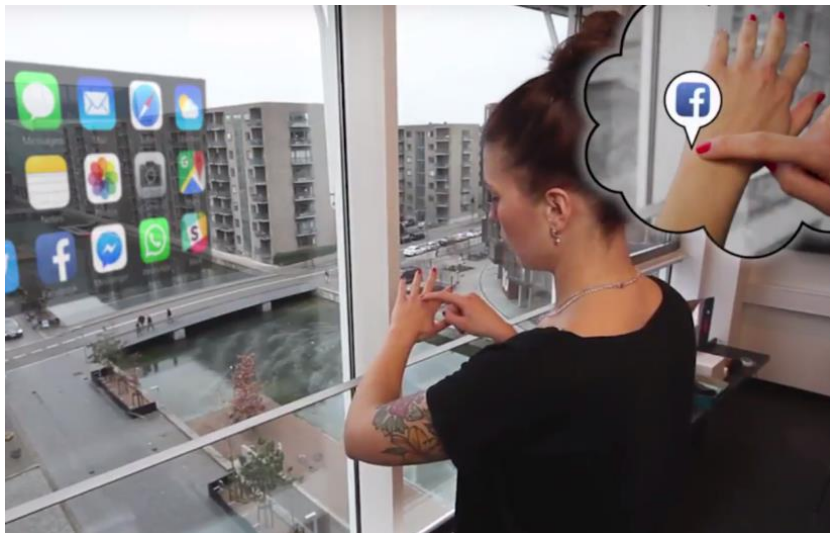
手や前腕への情報入力